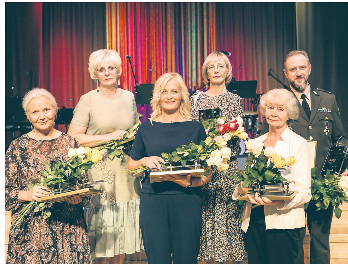
Apbalvojuma "Gada skolotājs 2022" laureāti

6. oktobrī Šlokenbekas muīzas ansambli Tukuma novada Izglītības pārvalde uz svinīgu skolotāju dienas pasākumu aicināja Tukuma novada pedagogus, lai godinātu pedagogus par izcilību un augstajiem sasniegumiem pedagogiskajā darbā, pasniedzot "Gada skolotājs" balvas, Izglītības un zinātnes ministrijas un Tukuma novada Izglītības pārvaldes Atzinības un Pateicības rakstus.