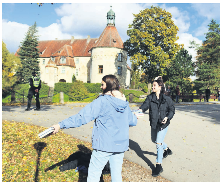
Jaunpils bibliotēkas rīkotā akcija "Grāmatu ķēdes"

1. novembrī notika bibliotēkas atklāšanas svētki. Līdz gada beigām bibliotēkā būs