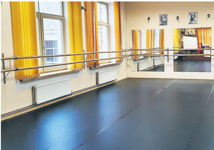
Vinila seguma deju grīda 80 m 2

Projekta mērķis bija papildināt Kandavas Deju skolas materiāli tehnisko bāzi, iegādājoties kvalitatīvu deju grīdas segumu, lai veiksmīgi realizētu deju programmas tautas dejās un mūsdienu dejā, kas virzītu dejas mākslas izglītību uz augstākiem panākumiem un sasniegumiem. Projekta ietvaros tika iegādāta vinila seguma