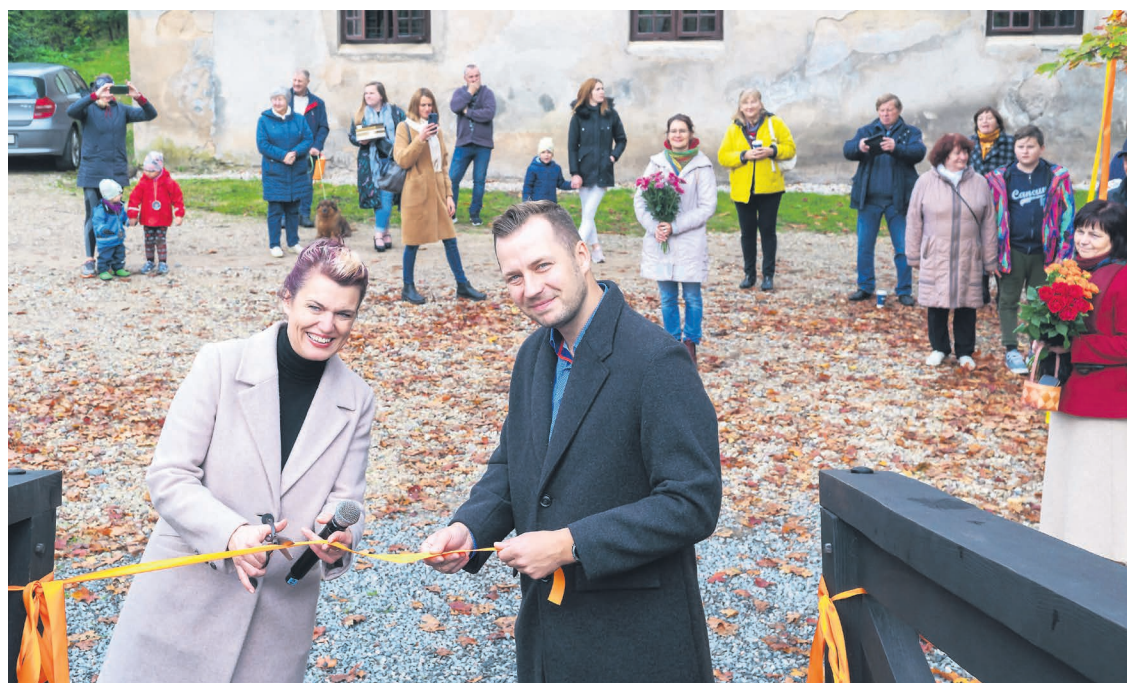
Aizvadītā mēnesī Smārdes pagastā atklāja Šlokenbekas muižas saliņu, noasfaltēja ceļa posmu Milzkalnē, atklāja mākslas studiju Smārdes pagastmājā, atzīmēja Vēju dārza 10 gadu jubileju, bet pāri visam – Lielajā ciemā lēca "Stirnu buks".

Milzkalnē veikta asfalta seguma izbūve pašvaldības autotceļam "Ventpsitjs šoseja–Jurģeļi–Bērziņu karjers–Milzkalnes stacija" projekta 4. kārtā – visišākajā, taču noslogotākajā ceļa posmā. Ar paugstinātas stiprības asfaltbetona segumu pašvaldība izbūvējusi puskilometru garu ceļa posmu no Milzkalnes dzelzceļa stacijas pārbrauktuves līdz Dur-