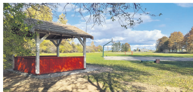
Lapene Vānes sporta laukumā

19. oktobrī noritēja kārtējā iedzīvotāju konsultatīvās padomes sanāksme, kurā tika apspriesti Vānes pagasta priekšlikumi jaunajam Tukuma novada teritorijas plānojumam, iedzī-