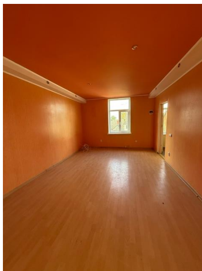
Istaba, telpa nr.3