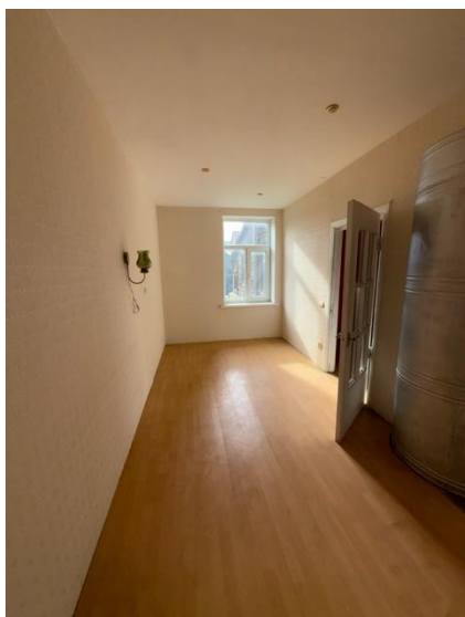
Istaba, telpa nr.2