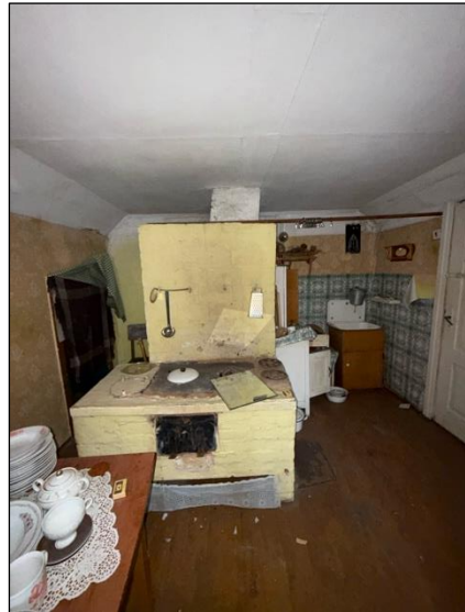
Apdzīvojama virtuve, telpa nr.1