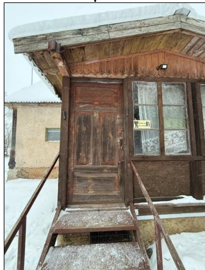
Koplietošanas telpu ārdurvis