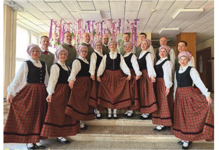
Vidējās paaudzes deju kolektīvs "Pūre"

Pūres KKS pamatdarbība ir balstīta uz aizdevumu izsniegšanu un noguldījumu piesaisti. Šo gadu laikā Pūres KKS pakalpojumi ir kļuvuši par būtisku atbalstu vietējai sabiedrībai un uzņēmējdarbībai visā Tukuma nova-