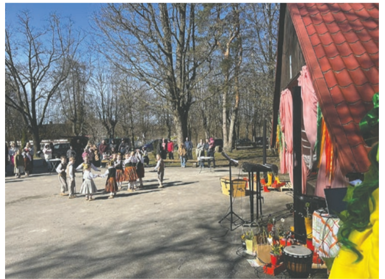
Lieldienu svinības Džūkstē

8. aprīlī nodarbībā "Dārzs uz palodzes" piedalījās Džūkstes