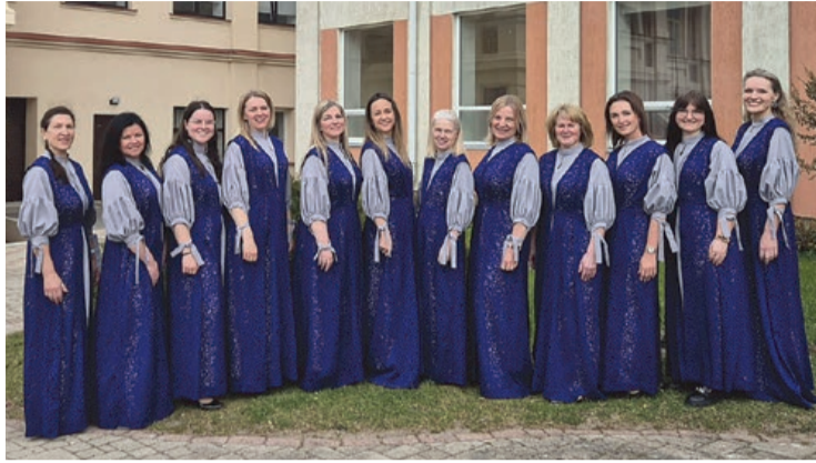
Jaunsātu Tautas nama sieviešu vokālais ansamblis "Kapriže"

Pūres un Jaunsātu amatiermākslas kolektīvi 2026. gada pavasara skatēs apliecinājuši augstu māksliniecisko līmeni, radošo degsmi un neatlaidīgu darbu. Katrs priekšnesums rūpīgi izstrādāts, demonstrējot gan dalībnieku