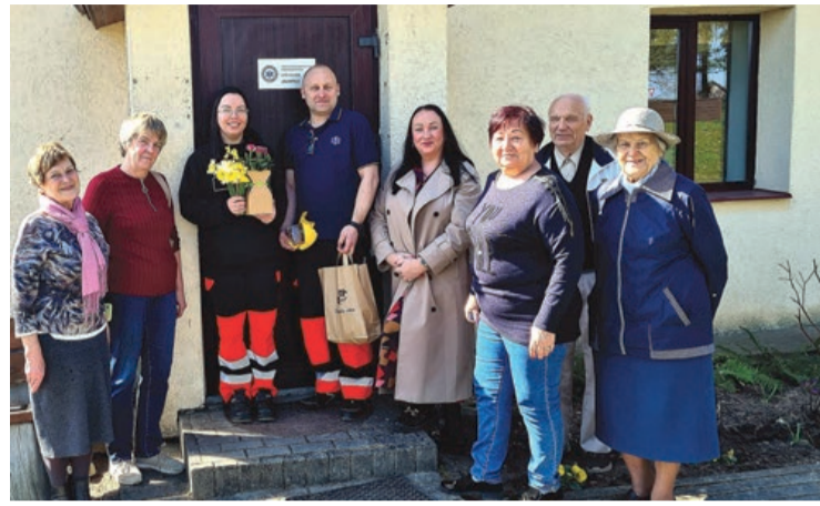
Jaunpilī atklāts jauns NMPD brigādes punkts

Karjeras izzināšanai un nākotnes plānošanai aprīlī sākumā notika vairākas aktivitātes. 1. aprīlī 37 skolēni piedalījās Ēnu dienā, iepazīstot dažādas profesijas reālajā darba vidē, bet 10. aprīlī 8. klases skolēni darbojās Nodarbinātības valsts aģentūras darbnīcā "Nākotne bez rāmjiem – Tavam talantam nav robežu!", kur analizēja savas stiprās puses un diskutēja par karjeras iespējām. Šo tēmu turpināja arī 7. klases organizētais pasākums "Iepazīsti profesijas", kas 17. aprīlī norisinājās Jaunpils pils zālē,