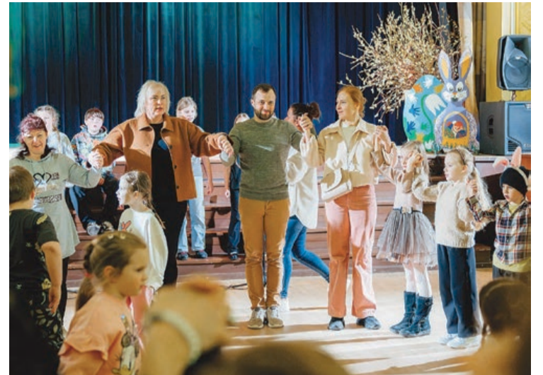
Lieldienu pasākums Lapmežciemā

Lapmežciema pamatskolā marts un aprīlis bijis notikumu un aktivitāšu piepildīts. Svarīgākais notikums skolai kopumā bija akreditācijas process un direktora profesionālās darbības novērtēšana. Akreditācijas komisija procesa laikā gan iepazīnās ar iestādes reglamentējošajiem dokumentiem, gan vēroja un analizēja mācību stundas, gan arī tikās un pārrunāja svarīgāko ar pašvaldības pārstāvjiem, skolas vadību, atbalsta komandu, pedagogiem, vecākiem un, protams, pašiem skolēniem. Pēc komisijas veiktajām sarunām un novērojumiem ir saņemta ne viena vien uzslava, un arī vairāki ieteikumi skolas darbības vēl pamatīgākai pilnveidošanai. Lapmežciema pamatskolas akreditācijas noslēguma ziņojums no komisijas vēl tiek gaidīts.