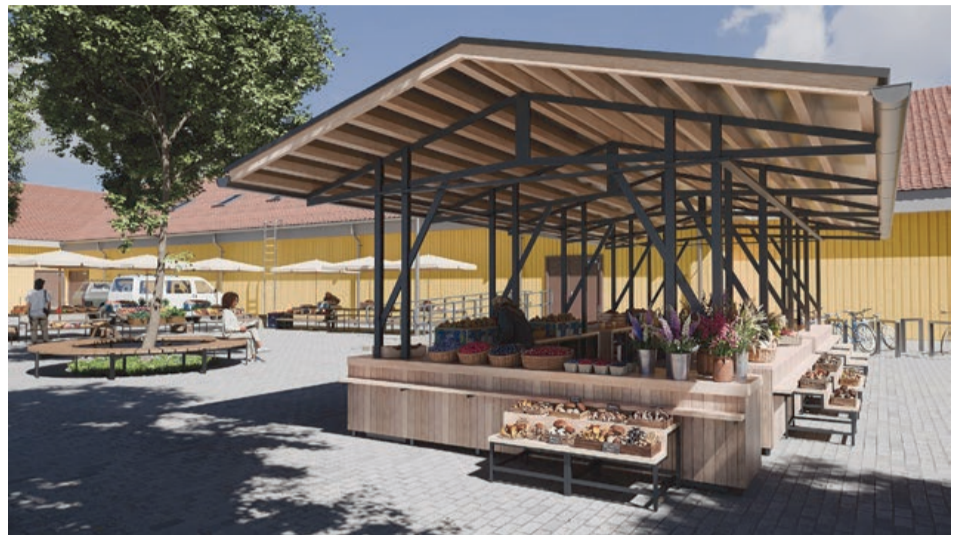
Tukuma tirgus laukuma pārbūves projekta vizualizācijas