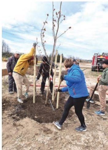
Ražīgi aizvadīta Lielā talka

Šlokenbekas muižā aizvadīti vairāki grandiozi pasākumi. To vidū – vidējās paaudzes deju kolektīva "Dzērves" koncerts "Dzēr-