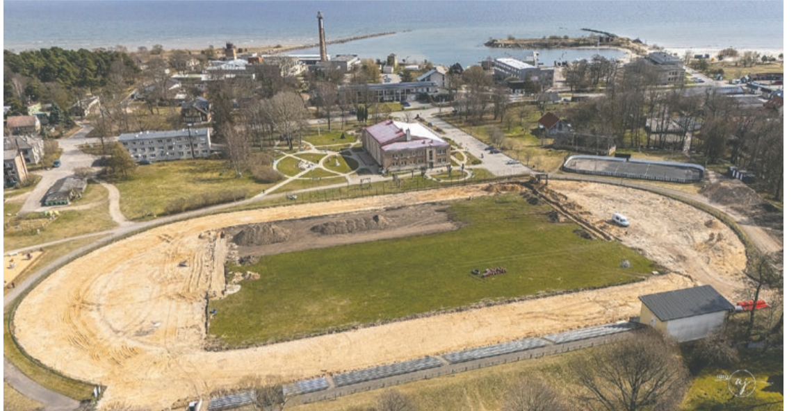
Engures stadiona pārbūve.

Engures vidusskola lepojas ar skolēnu sasniegumiem – gūti augsti rezultāti koru skatē, olimpiādēs un dažādos konkursos. Vienlaikus aprīlī uzsākās valsts monitoringa un diagnosticējošie darbi, kas turpināsies arī maijā. Mēneša laikā tika sasaukta arī skolas vecāku padomes sanāksme, lai pārrunātu aktuālos jautājumus un veicinātu sadarbību. Aprīļa izskaņā aktīvi iesaistījies mēneša talsas aktivitātēs, rūpējoties par apkārtnes vidi, savukārt mēneša noslēgumā svinīgajā līnijā atzīmējām Latvijas Republikas