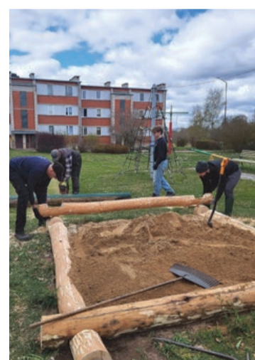
Rosība Lielajā talkā

Vienlaikus atgādinām, ka vēl līdz 17. maijam ir iespēja nobalsot par iesniegtajiem līdzdalības bu-