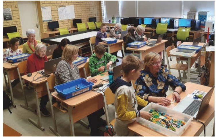
Projekta "Kods savieno paaudzes – programmēšana un robotika visai kopienai" aktivitātes

ESF+ projekta "STEM un pilsoniskās līdzdalības norises plašākai izglītības pieredzei un karjeras izvēlei" ietvaros 1.–3. klašu skolēni pārtapa par mazajiem zinātniekiem un kopā ar Ventpils zinātnes centra "Vizium" pārstāvēm devās "burbuļojošās gāzes ceļojumā", praktiski iepazīstot gāzu īpašības un ķīmiskās reakcijas. 7.–9. klašu skolēniem notika nodarbība "Vērtību izvēle: es, citi un sabiedrība".