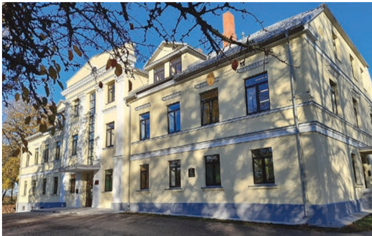
Cēres skolas ēka Cēres pagastā

Izglītojamajiem būs iespēja arī turpināt mācības Kandavas pilsētas pirmsskolas izglītības