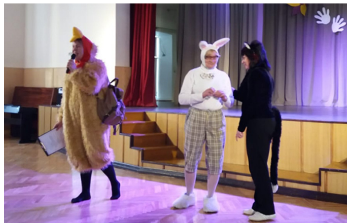
Pasaku tēva A. Lerha-Puškaiša jubilejas gadā koncertu kuplināja pasaku tēli.

To šogad vienoja moto: "Mēs esam ne tikai dziedātāju, dejotāju zeme, mēs nākam arī no pasaku tēva A. Lerha-Puškaiša ze-