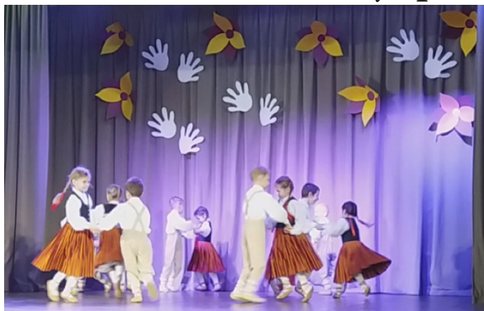
Visi festivāla "Raitu soli Jaunajā gadiņā" dalībnieki uzstājās ar lielu aizrautību.

14. februārī – tieši Valentīndienā – Džūkstes Kultūras namā "iedejoja" pavasaris. Vairāk nekā divi simti mazo "putnēnu" no Pūres, Jaunpils, Irlavas, Tumes, Jaunsātiem, Viesatām, Smārdes un Džūkstes iedejoja gadskārtējā festivālā "Raitu soli Jaunajā gadiņā".