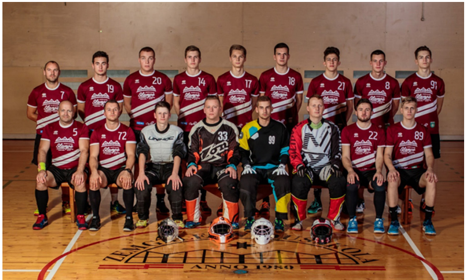
SK "Slampe/Zevīd" sekmīgi aizvadījusi Latvijas čempionāta 2. līgas regulāro sezonu.

Slampes florbolisti piedalās Engures novada čempionātā florbolā. 16. februārī