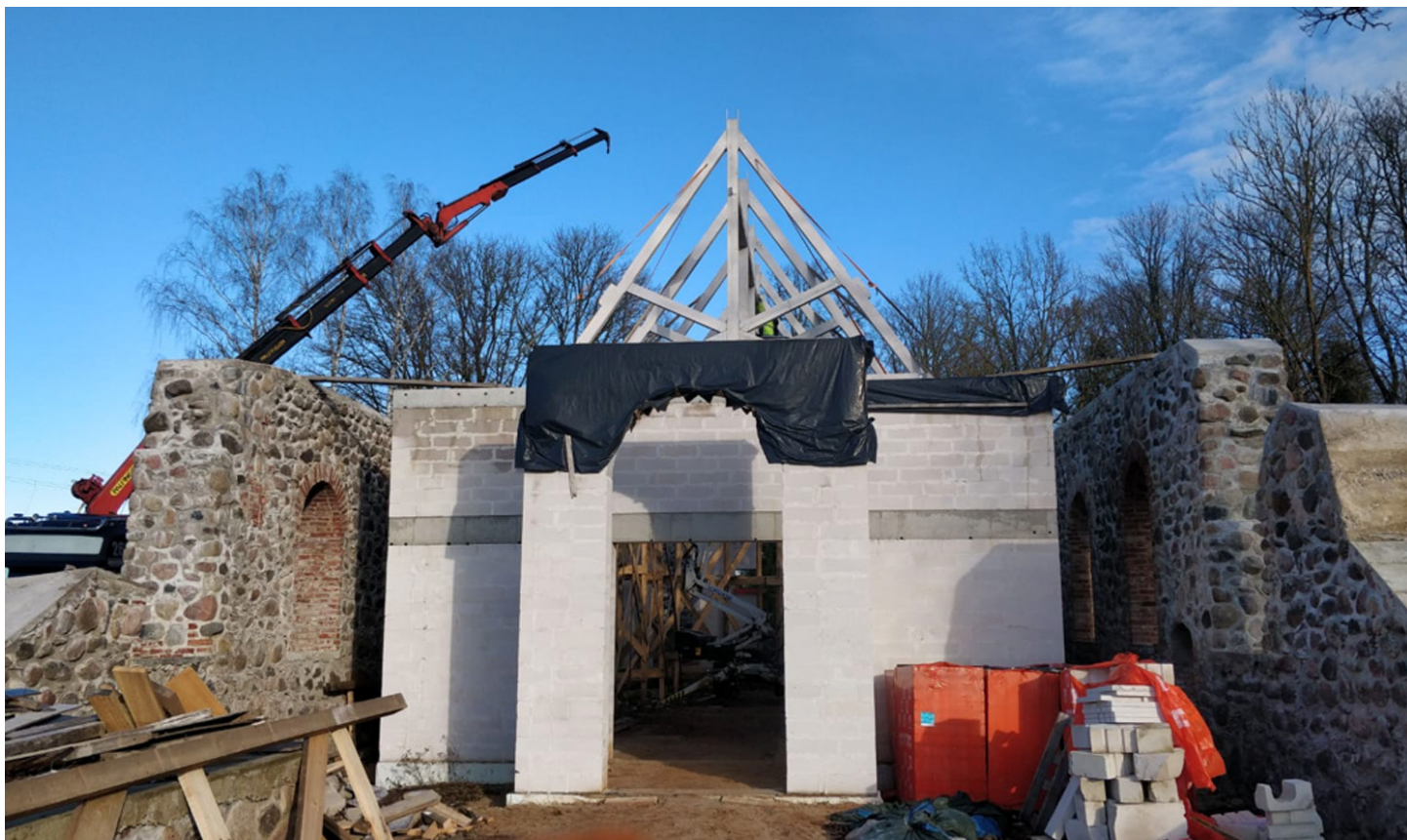
Pamazām 1944.gada Ziemassvētkos nopostītās Džūkstes baznīcas drupās top jauns dievnams. Pateicoties ziedotājiem, celtniecība turpinās – marta sākumā baznīcai uzstādītas jumta kopnes.