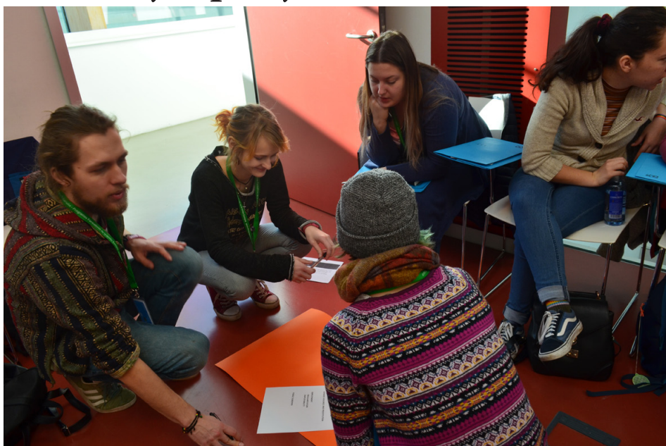
Jaunatnes darbinieki un jaunieši no Tukuma veido informatīvo plakātu par imigrāciju Latvijā.

Pēdējā organizācija, ar ko iepazīnās vi-